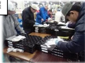
倉庫内作業・除雪など