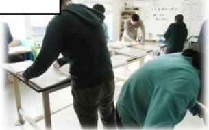
封入差し込み作業・箱折・シール貼など