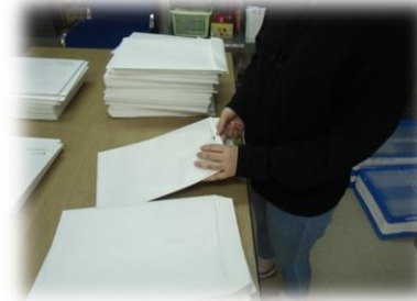
封入作業・シール貼など