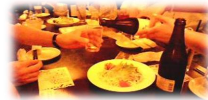
余暇支援：食事会・レクリエーションの企画