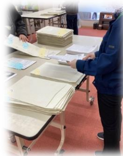
ふうにゆうさぎょう しーるはり はこお 封入作業・シール貼・箱折りなど