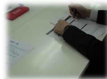
かんじ けいさん き そがくりよく けんでいしけん おこ 漢字・計算などの基礎学力やPCではワープロ検定試験を行なっています