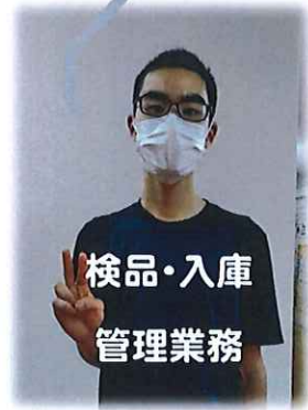
検品・入庫 管理業務