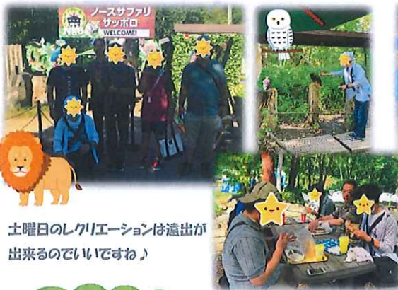
土曜日のレクリエーションは遠出が出来るのでいいですね♪